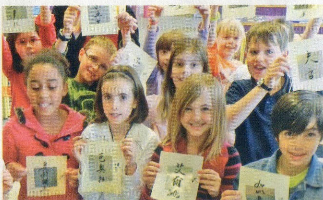
到訪盧森堡歐盟學校