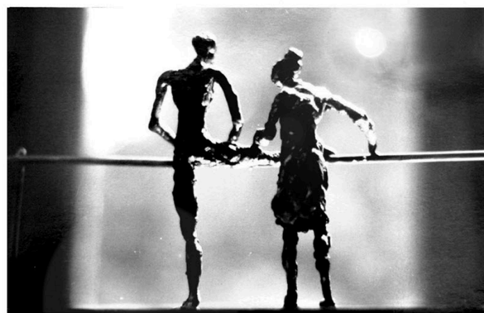
Három elem játsza a fő szerepet esztétikai keresésében és műveiben: az absztrakció, a szintézis és a linearitás.

A tehetség egy sivatagi kúthoz hasonlítható. A mélyben rejlő víz, a kreativitás, képes a sivatagban is életben tartani. Sőt, egyszer csak forrásként buggyanhat a felszínre, egészen váratlanul. Velem is így történt. Nyolc év elteltével kezdtem ismét szobrászkodni. Ekkor találtam