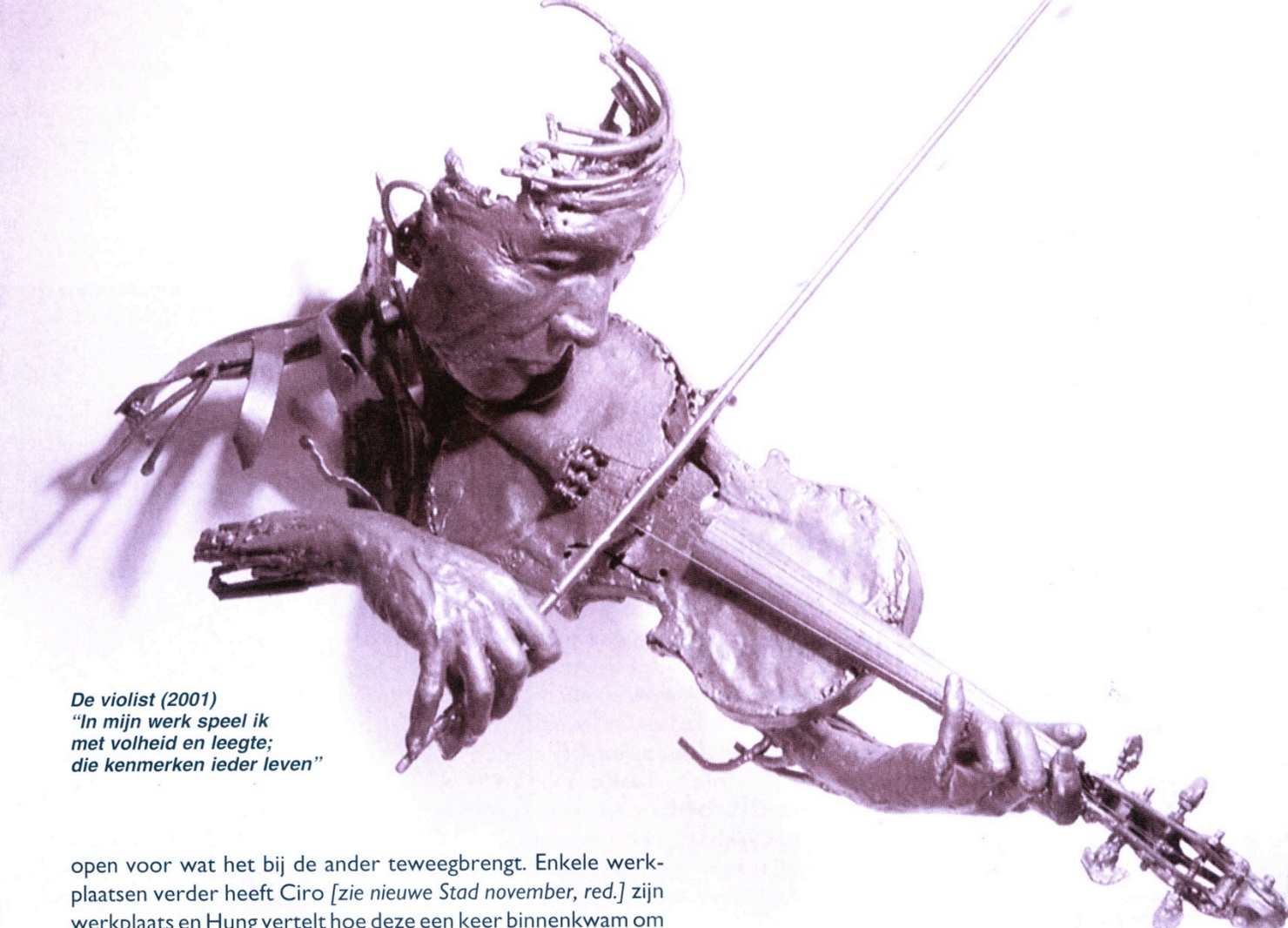
De violist (2001) "In mijn werk speel ik met volheid en leegte; die kenmerken ieder leven"

Het is voor Hung een manier om te dialogeren, te vertellen wat er in hem leeft. Door middel van zijn kunst stelt hij zich